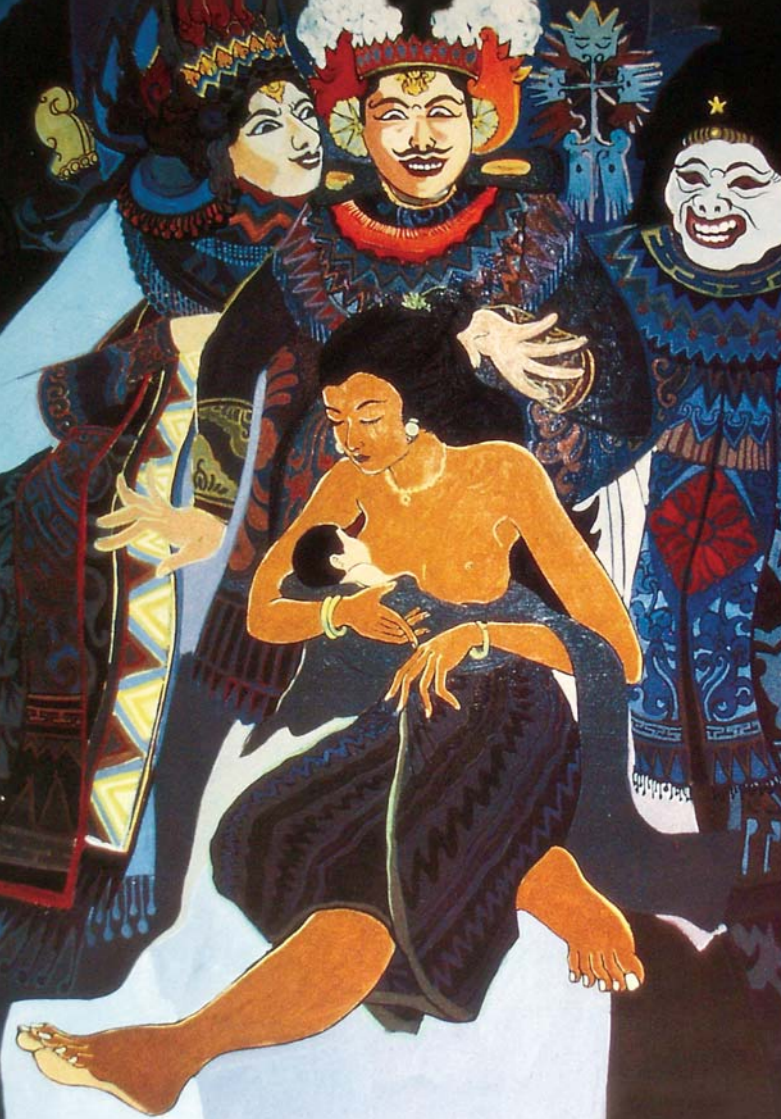
„Die drei Weisen“ von Nyoman Darsane, Bali, aus dem missio-Kunstkalender 1992 Bali.

Gleichzeitig leidet der Kontinent, auf dem mehr als die Hälfte aller Katholiken weltweit leben, an einer pastoralen Unterversorgung, vor allem in den Landbezirken mit ihren überdimensional großen Pfarreien, aber auch in den rasant wachsenden Städten. Dieser Mangel macht es Sekten leicht, mit magischen Riten und fundamentalistischer Bibelauslegung Fuß zu fassen. Es gilt, Priester, Ordensleute und Katecheten für Lateinamerika zu fördern und die charismatische Bewegung als kraftvolle katholische Antwort gegen Sektierertum zu unterstützen.