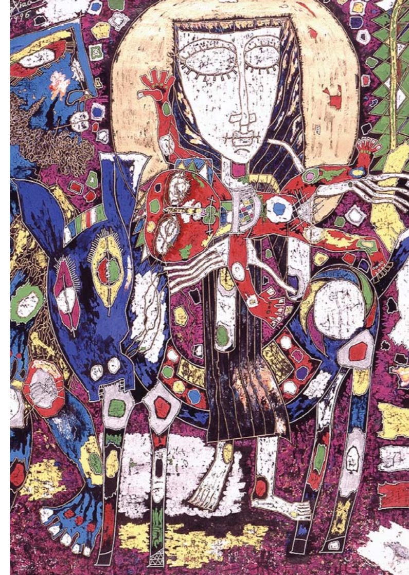
„Flucht nach Ägypten“ von Qin Peng Xiao, China, aus dem missio-Kunstkalender 1998 China.

Auch Maria, die Mutter dessen, der für die Menschen Mensch geworden ist, hatte den Mut, dem Neuen durch das Altvertraute hindurch zu folgen. Zusammen mit Maria bitten wir ihren Sohn, der uns das Evangelium verkündet hat, für die Kirche in Ozeanien.