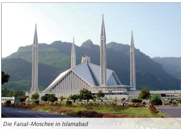
Die Faisal-Moschee in Islamabad

Fläche: 796.095 km 2 und damit etwa zweimal so groß wie Deutschland